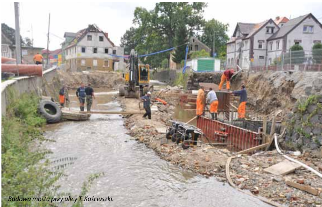
Budowa mostu przy ulicy T. Kościuszki.

wymiana nawierzchni w parze muszą iść także remonty sieci wodnej, kanalizacyjnej, trzeba także naprawić oświetlenie uliczne. Nie sposób także wykonać remontu bez uzupełnienia murów oporowych. Najważniejsze, że mamy środki finansowe. Miejmy nadzieję, że pogoda dopisze i wszystkie najważniejsze prace zakończą się w terminie”. – dodaje burmistrz Andrzej Grzmielewicz.