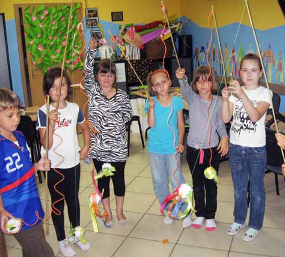
Akcja Lato 2011.