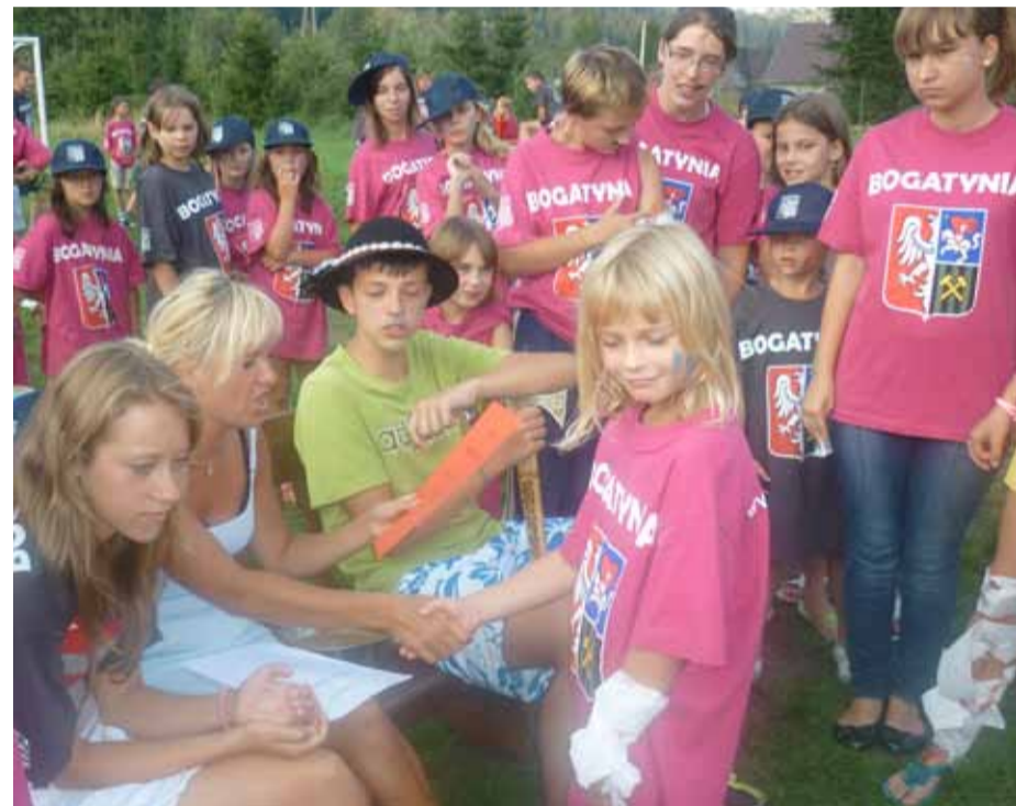
Uczestnicy III turnusu Kolonii