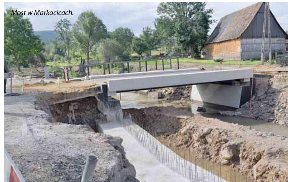
Most w Markocicach.