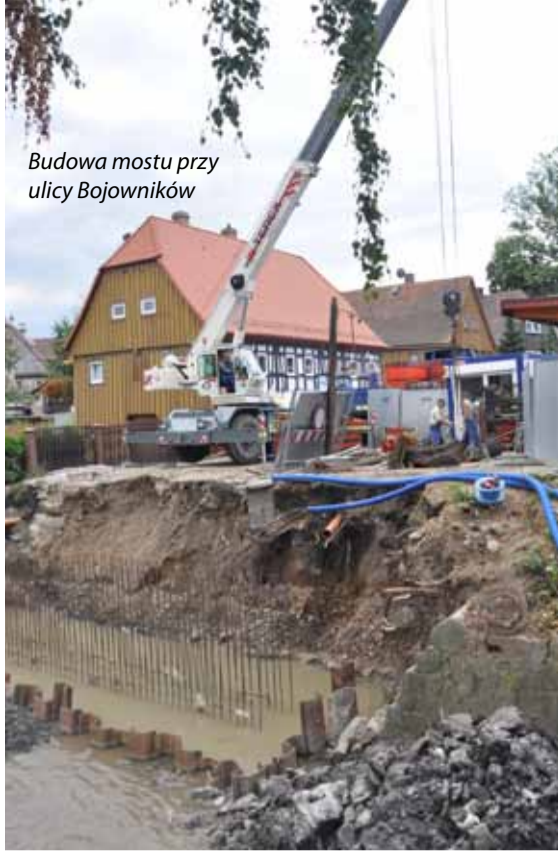
Budowa mostu przy ulicy Bojowników