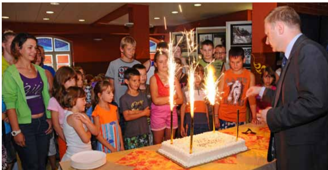
Zakończenie Akcji Lato 2011.