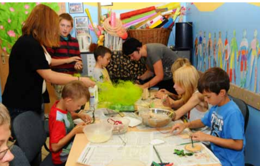
Akcja Lato 2011.