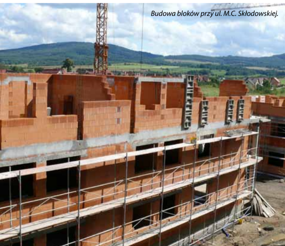
Budowa bloków przy ul. M.C. Skłodowskiej.

dowanym mieszkańcom dachu nad głową. Dotychczas oddano 40 mieszkań dla powodzian. Przy ulicy M.C. Skłodowskiej trwa budowa 3 bloków komunalnych, razem 82 mieszkania. Łączna powierzchnia budowanych lokali mieszkalnych to 4,911.05 m 2 . Wartość inwestycji to 12 mln złotych, prawie 5 mln dołożył Bank Gospodarstwa Krajowego. W nowych blokach powstaną mieszkania o różnej strukturze od 1 do 4 pokojowych. Każde z mieszkań będzie posiadało balkon lub loggie. Do usytuowanych na parterze, będzie zapewniony dostęp dla osób niepełnosprawnych. Wokół budynków zaprojektowano