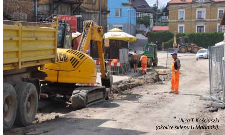
Ulica T. Kościuszki (okolice sklepu U Marianki).