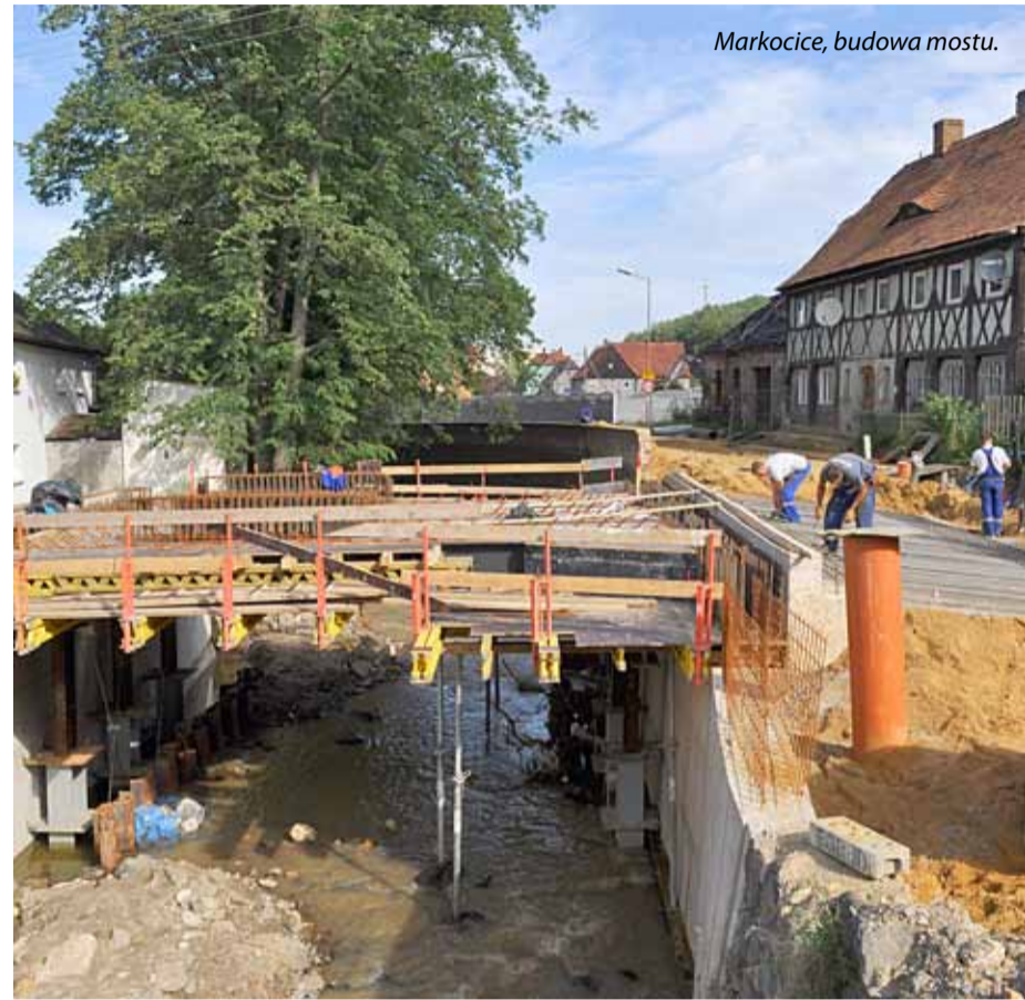
Markocice, budowa mostu.

miejsca parkingowe oraz niskie nasadzenia i krzewy. Planowany termin zakończenia tej inwestycji to lipiec przyszłego roku.