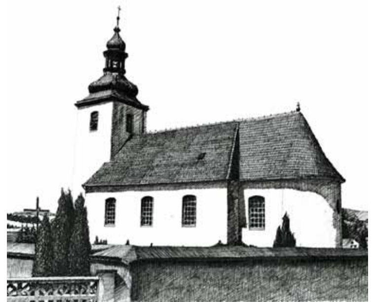
Kościół pw. św. Jana Chrzciciela w Krzewinie Rys. Grzegorz Urban

mąkę i pół łyżeczki proszku do pieczenia, dodajemy bakalie, żurawinę, rodzynki, smażoną skórkę pomarańczową, cukier oraz aromat waniliowy. Na koniec ubijamy pianę z białek wraz ze szczyptą soli i delikatnie mieszamy z uzyskaną masą serową. Całość wykładamy na blachę i pieczemy 40 minut w temperaturze 180 stopni. Następnie dekorujemy polewą. Smacznego!