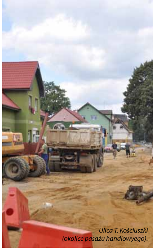
Ulica T. Kościuszki (okolice pasażu handlowego).