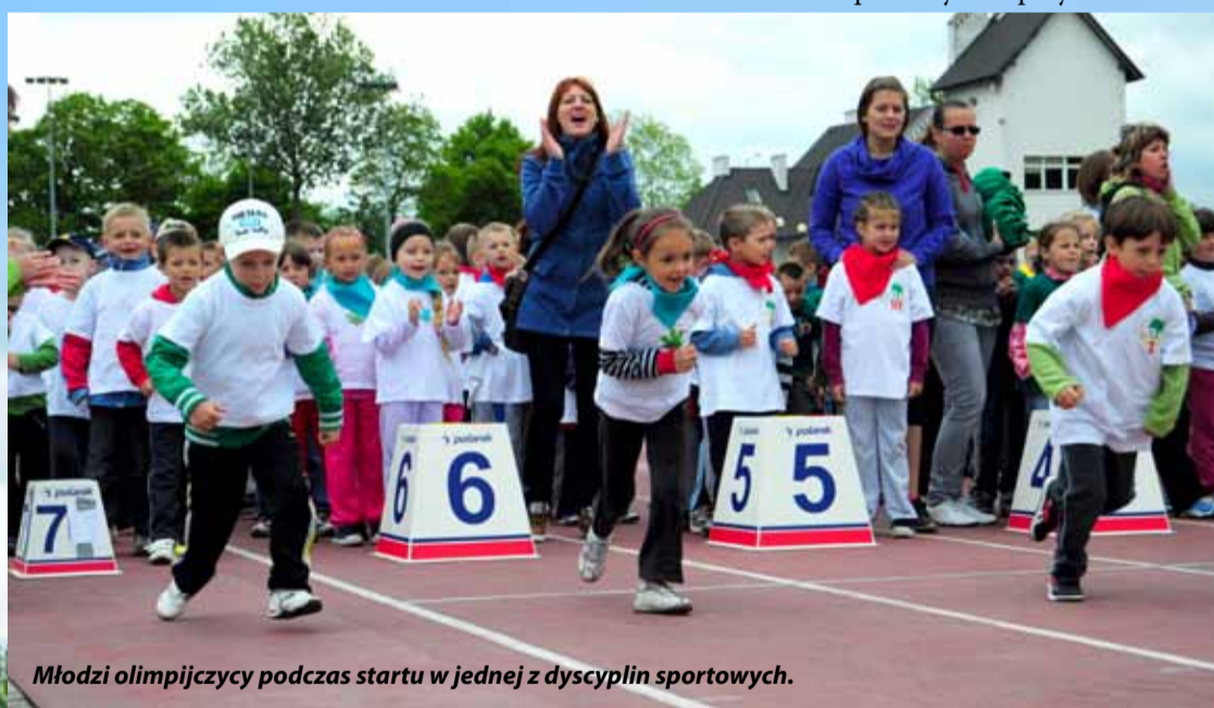
Młodzi olimpijczycy podczas startu w jednej z dyscyplin sportowych.