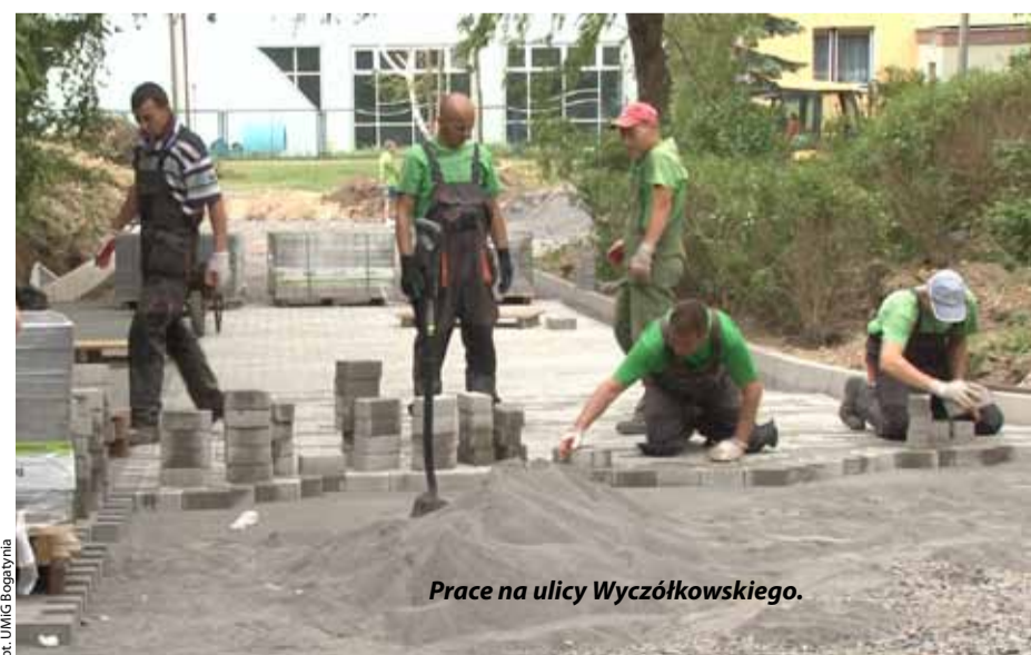
Prace na ulicy Wyczółkowskiego.

nia prac to sierpień br. Oczywiście przy realizacji wszystkich zadań zarezerwowane i oznaczone zostaną miejsca parkingowe dla osób niepełnosprawnych. Wspomniane inwestycje wykonuje na zlecenie samorządu Gminne Przedsiębiorstwo Oczyszczania z Bogatyni.