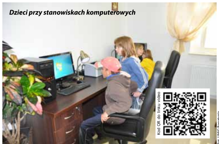
Dzieci przy stanowiskach komputerowych