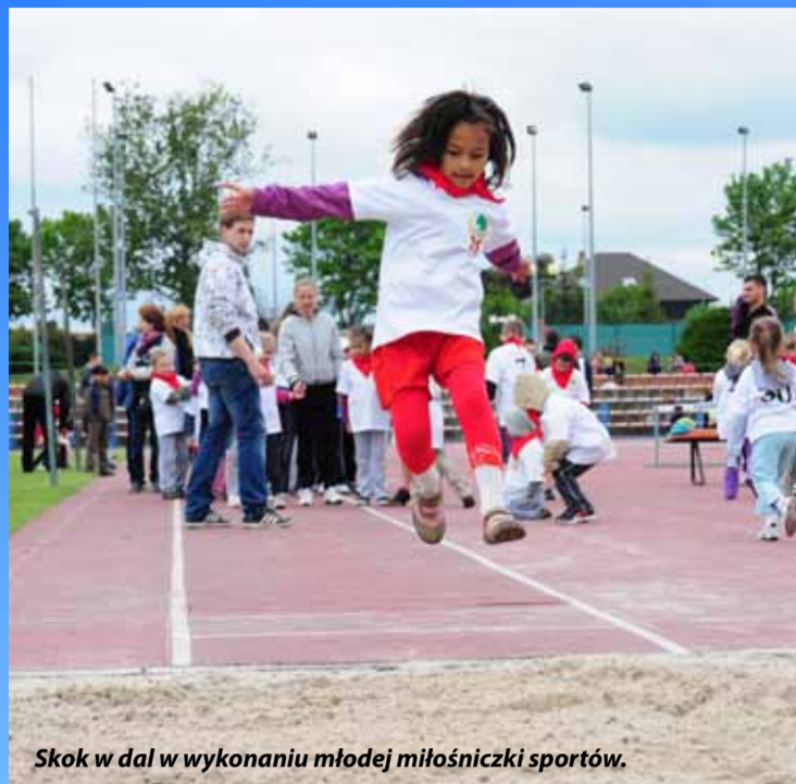
Skok w dal w wykonaniu młodej miłośniczki sportów.