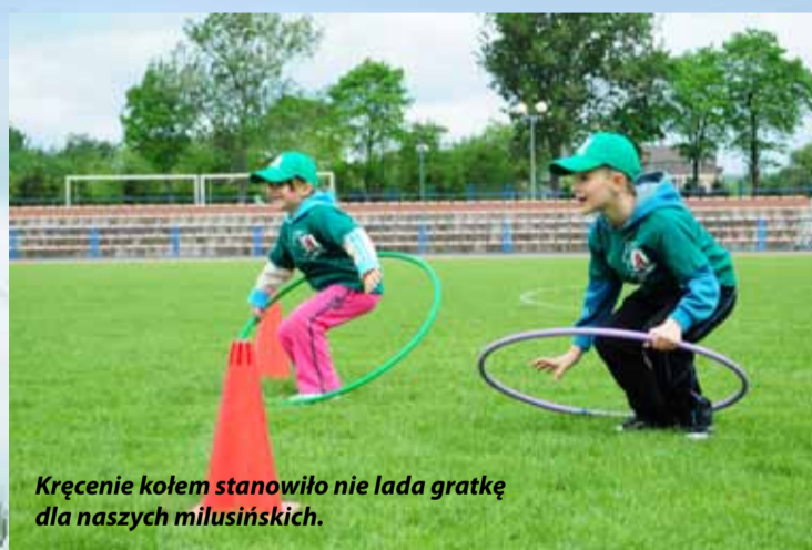
Kręcenie kołem stanowiło nie lada gratkę dla naszych milusińskich.