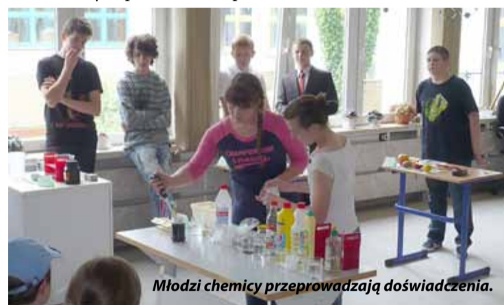
Młodzi chemicy przeprowadzają doświadczenia.

Festiwal Nauki i Zabawy zakończył się występem Chóru Międzynarodowego w kościele w Porajowie. Imprezę przygotowywali rodzice, nauczyciele oraz pracownicy administracji i obsługi szkoły. Wszystkim zaangażowanym osobom oraz sponsorom serdecznie dziękujemy. Zapraszamy za rok.