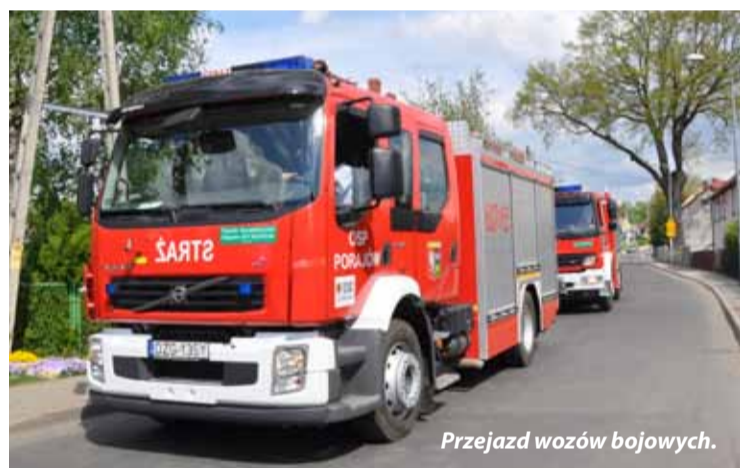
Przejazd wozów bojowych.