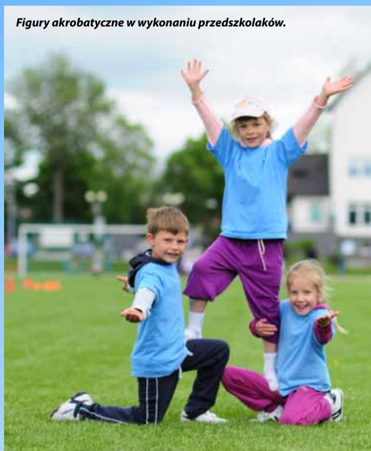
Figury akrobatyczne w wykonaniu przedszkolaków.