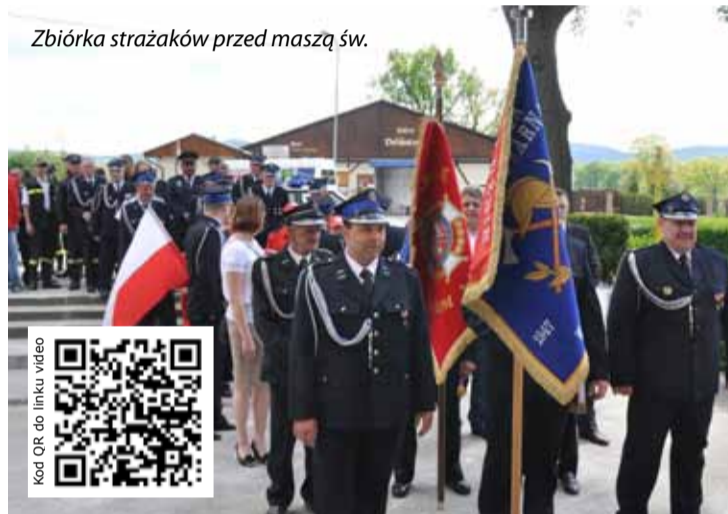
Zbiórka strażaków przed maszą św.