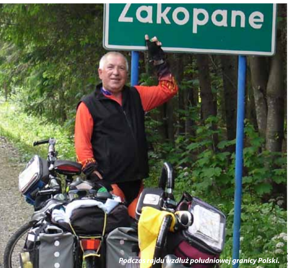
Podczas rajdu wzdłuż południowej granicy Polski.

Dziękuję panu za rozmowę, życząc niesamowitych rajdów.