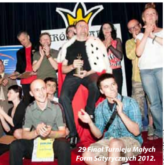
29 Finał Turnieju Małych Form Satyrycznych 2012.