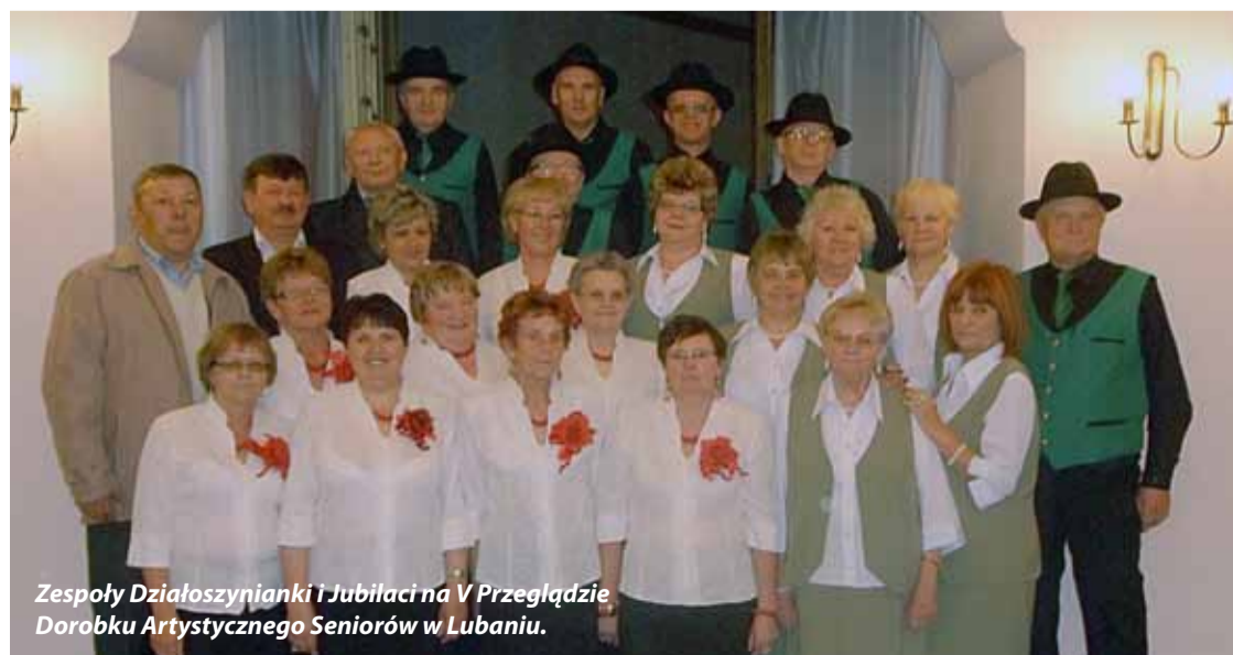
Zespoły Działoszynianki i Jubilaci na V Przeglądzie Dorobku Artystycznego Seniorów w Lubaniu.

artystycznego. Zespół Jubilaci zdobył 1 miejsce w kategorii soliści, 2 miejsce w kat. kabarety, wyróżnienie w kat. zespoły wokально-instrumentalne oraz wyróżnienie w kat. rękodzieła artystycznego. Otrzymane nagrody i wyróżnienia są tym cenniejsze, gdyż udział w przeglądzie brały zespoły z całego województwa dolnośląskiego oraz z miast dużo większych niż nasze.