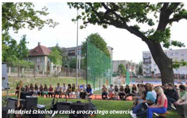
Młodzież szkolna w czasie uroczystego otwarcia

Liceum w Bogatyni” to boisko wielofunkcyjne, w którego w skład wchodzi boisko do piłki nożnej, 4-torowa bieżnia, skocznia do skoku w dal, wraz z infrastrukturą towarzyszącą (chodniki, trybuny, budynek szatni z sanitariatem).