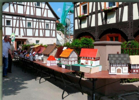
Bogatynia Dzień.Otw.Dom.Przysł - 2012r ul Waryńskiego