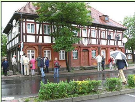
Bogatynia - ul 1 Maja 2012r.

Dzień Otwartych Domów Przystupowych jest to największe wydarzenie na trójstyku Polski, Czech i Niemiec obchodzone od 12 lat, zawsze w ostatnią niedzielę maja. Tego dnia bohaterami nie są ludzie, tylko stare drewniane domy, które pozostają niemymi świadkami historycznych przemian dokonywanych w środku Europy.