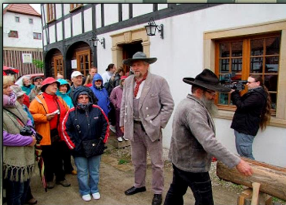
Bogatynia Dzień.Otw.Dom.Przysł - 2016r ul Waryńskiego