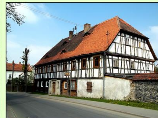
Bogatynia - Markocice2016r. - ul. Główna.

Dzień Otwartych Domów Przystupowych przyczynia się do wsparcia procesu tworzenia „wspólnej marki regionu” opartej na historycznym zasobie kultury materialnej gdzie poprzez kształtowanie świadomości buduje się lokalną tożsamość.