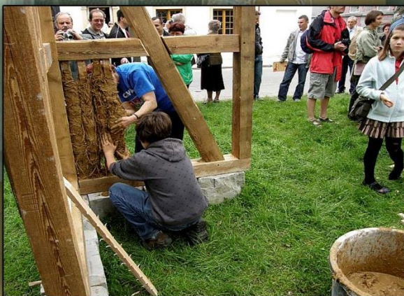
Bogatynia Dzień.Otw.Dom.Przysł - 2012r ul Waryńskiego

Tym co łączy nasze trzy kraje, jest wspólna historia. Jednym z jej świadków jest dom przysłupowy. Zachowanie tego dziedzictwa kultury jest ideą wiodącą całego projektu Kraina Domów Przysłupowych, by ta właśnie zabudowa stała się wyraźnym znakiem rozpoznawczym naszego regionu.