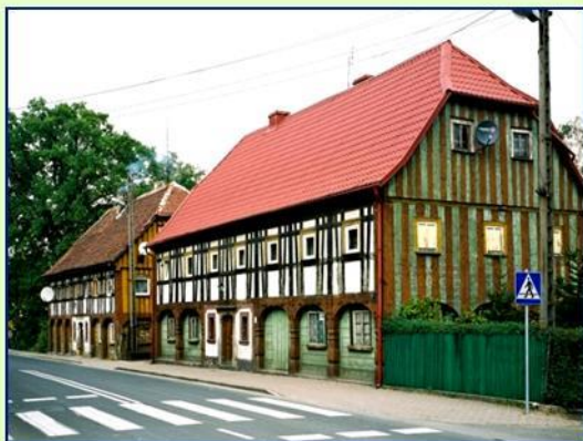
Bogatynia - ul 1 Maja 2014r..

To wydarzenie jest doskonałą okazją do przyjrzenia się z bliska jak doszło do połączenia dwóch kultur budowlanych. To tu na Łużycach słowiańskie parterowe domki, zostały „otulone” na zewnątrz słupami i nadbudowane piętrem, wzniesionym w technice konstrukcji ryglowej wypełnionej słomą i gliną - przybyłą z Frankonii.